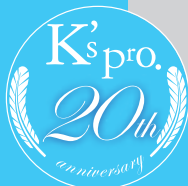
Illustrated by Masayuki Iketani, Design by t.d.r.